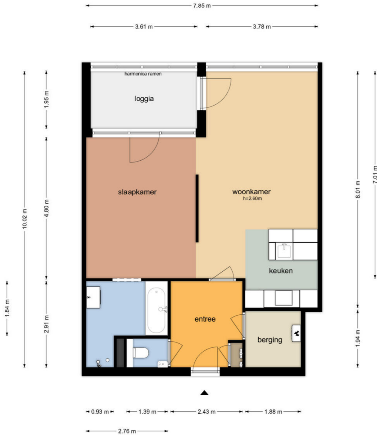
Dijkmeerlaan 355 - Amsterdam Derde Verdieping

De plattegronden zijn geproduceerd voor promotionele doeleinden en ter indicatie. Aan de plattegronden kunnen geen rechten worden ontleend