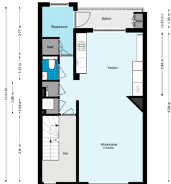
Marco Polostraat 266-3 - Amsterdam Vierde verdieping